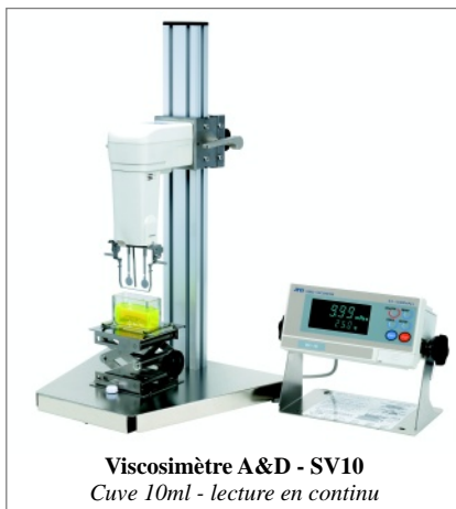
Viscosimètre A&D - SV10 Cuve 10ml - lecture en continu

La recherche en terme de création de formule trouve un certain nombre d'obstacles, et tout particulièrement ceux liés aux propriétés physico-chimiques des produits mis au point.